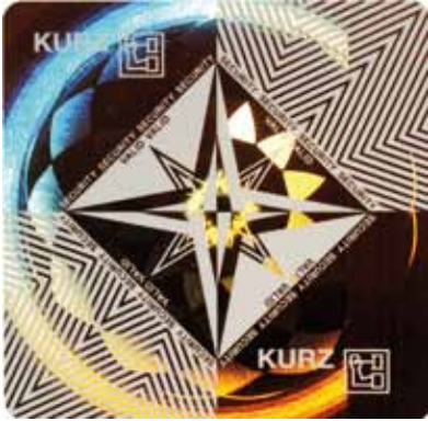
Partiell metallisierte OVD SecuPlus von Kurz. Die weißen Teile im Bild sind transparent.

Schmuck, Sicherheit und individuelle Gestaltung kommen bei dieser Hologrammart zusammen. Als optisches Sicherheitssystem, kombiniert mit gestalterischer Freiheit, sind diese Folien ideal für kostengünstige Brand Protection Lösungen. Hologramme werden mit einem Planwerkzeug in der vorgegebenen Größe mit einem leichten Eckradius geprägt. Dazu ist eine Hologrammsteuerung nötig, die mit einem Laser die exakte Position der Folie bestimmt. Der Bedruckstoff sollte möglichst glatt sein, da die Faserstruktur (zum Beispiel bei Naturpapieren) die feinen Linienstrukturen des Hologrammes tangiert und die Reflexwirkung mindert.