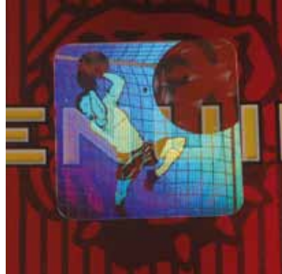
Transparentes Trustseal® Einzelbildhologramm „Safer“ von Kurz.

Folienmuster erhalten sie bei ihrem Prägepartner, der sie auch über den Einsatz und die Wirkung informieren kann.